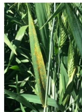
Hoja bandera infectada

Importante recordar que el buen llenado del grano de trigo depende de la sanidad que presente la hoja bandera y actualmente las infecciones las estamos detectando precisamente en dicha hoja, por esto damos la voz de alerta a todos los productores para que tomen las medidas que el caso amerite actuando en tiempo y forma para evitar daños de importancia económica.